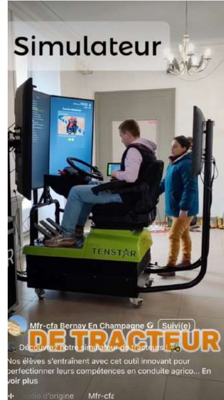
Facebook Le 17/01/2025 6 136 vues au 30-01