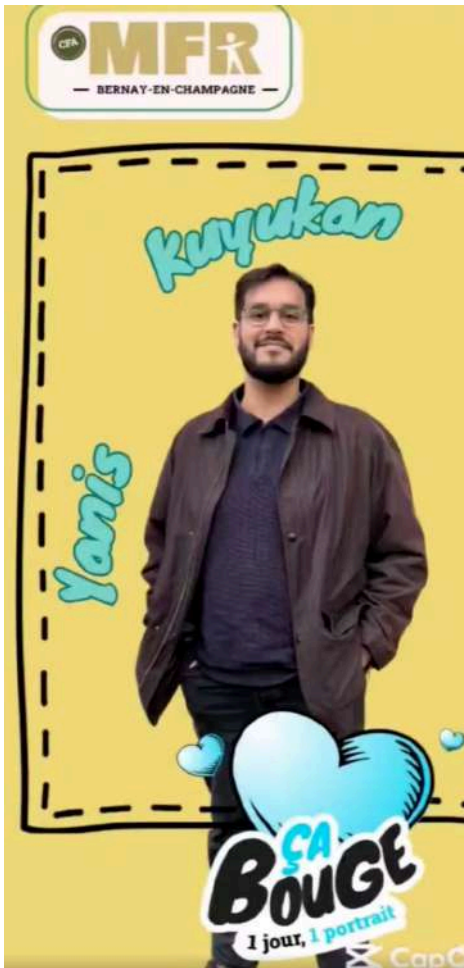
Facebook Le 21/01/2025 3 289 vues au 30-01