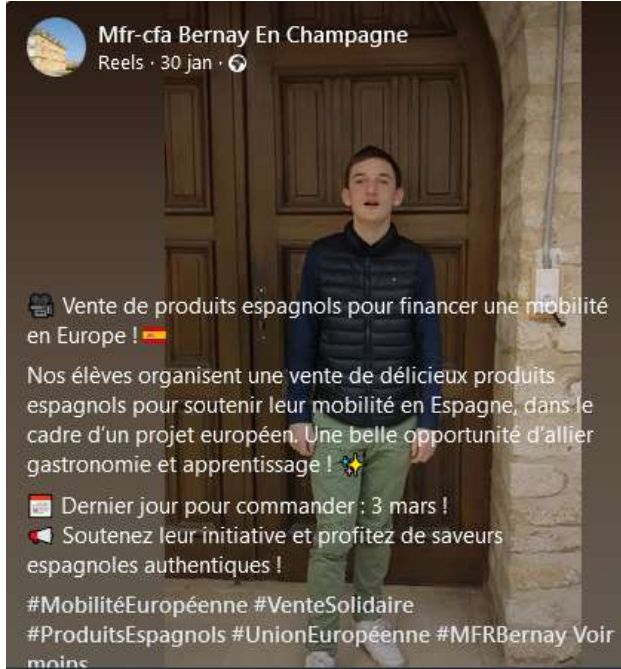
Facebook - Le 30-01-2025